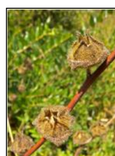
Fruit de Lavatera olbia