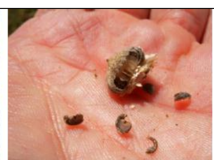
Fruit i llavors de Lavatera olbia